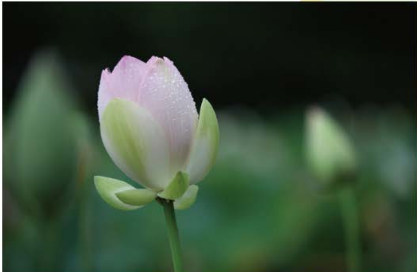
写真：ハス(蓮) ハス科 花言葉/雄弁・休養・沈着・神聖・清らかな心