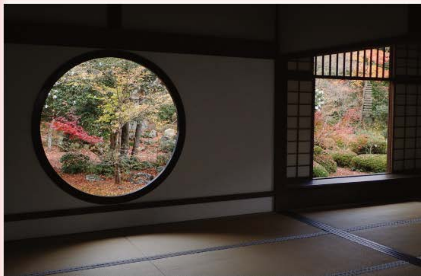
写真:「日光庵」京都 借りの窓・遊いの窓 DATE カメラ:オリンパス STYLUS TG-4 ホワイトバランス: AUTO シャッタースピード:1/250 F2.7 ISO感度:100 補正:-1.0